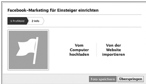
Abbildung 3.6: Screenshot „Profilbild hinzufügen“