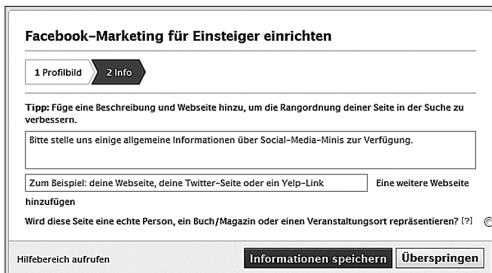
Abbildung 3.7: Screenshot Kurzbeschreibung